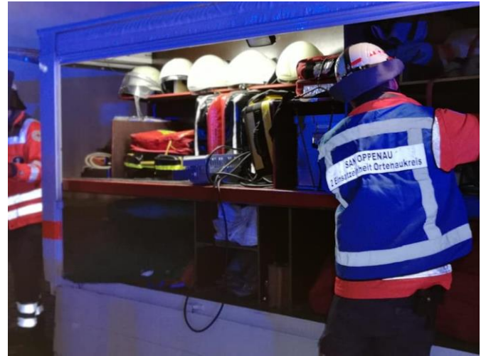
Materialanhänger im Einsatz

Angenommen wurde ein Brand im alten Rathaus, bei dem es mehrere Verletzte gibt.