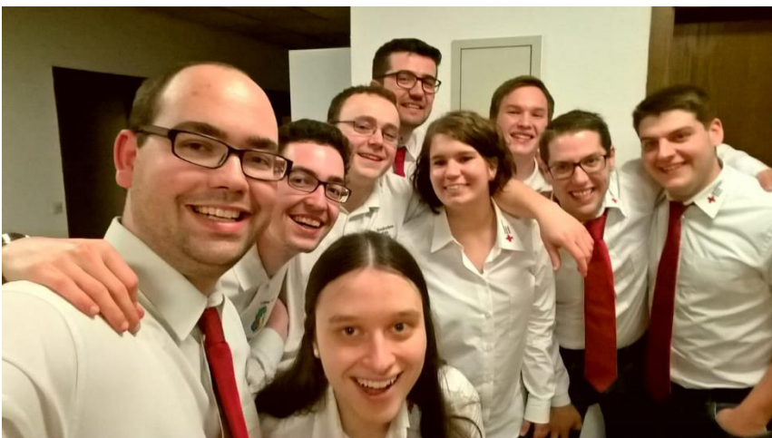
Unsere Gruppenleiter bei der Mitgliederversammlung 2019

Das Jugendrotkreuz konnte sich durch eine zweckgebundene Spende für die Jugendarbeit über einige neue Spiele freuen