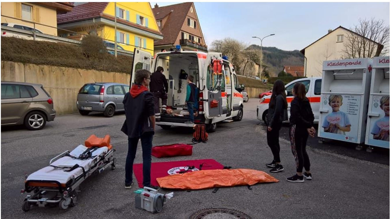
Unser Jugendrotkreuz im Jahr 2019 am Üben