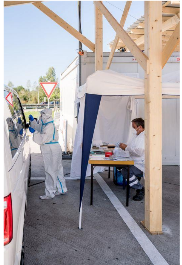
Teststelle für Reiserückkehrer, A5 bei Neuenburg

Auch bei den mobilen Impfteams, die beispielsweise in Pflegeheimen aktiv sind, wirken Oppenauer Rot Kreuzler mit.