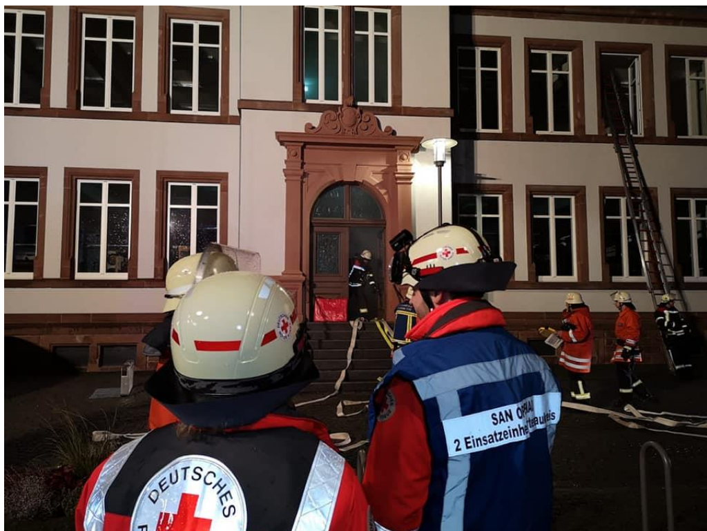
Übung: „Brand im alten Rathaus Oppenau“

Resümee der Übung: Die Zusammenarbeit funktionierte untereinander und mit der Feuerwehr reibungslos