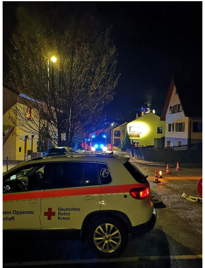
Kaminbrand in Offenburg, Januar 2020

Unsere Einsatzleiter leiteten so mehrere Einsätze, unter anderem einen Kaminbrand in Offenburg.